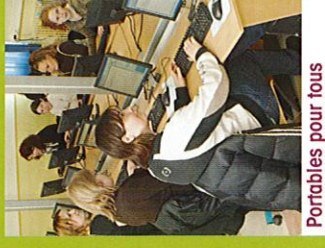
Portables pour tous

Tout neuf, tout blanc, et tellement plus agréable! Le Labo de Chimie a profité de sa rénovation totale pour être parfaitement mis aux normes, équipé, et sécurisé: un vrai plaisir pour nos apprentis chimistes et pour leur professeur!