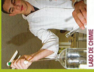
LABO DE CHIMIE

Tout neuf, tout blanc, et tellement plus agréable! Le Labo de Chimie a profité de sa rénovation totale pour être parfaitement mis aux normes, équipé, et sécurisé: un vrai plaisir pour nos apprentis chimistes et pour leur professeur!